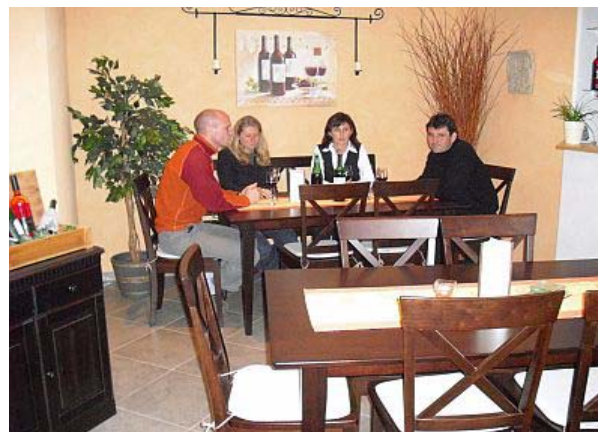
Mit Gästen in unserer Weinprobierstube

I n unserer neuen, mediterran errichteten, Weinprobierstube (bis 20 Personen) finden Sie die richtige Atmosphäre für eine gelungene Weinprobe, welche von unserem Winzermeister durchgeführt wird.