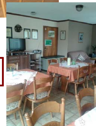
Doppelzimmer u. Aufenthaltsraum

E in Frühstücks- bzw. Aufenthaltsraum mit Farbfernseher, Gästekühlschrank, hauseigener Parkplatz sowie ein Unterstellplatz für Fahrräder stehen unseren Gästen zur Verfügung.