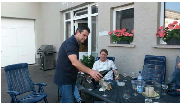
Der Winzermeister - persönlich -

U nser gemütliche Sitzecke, lädt Sie zu erholsamen Stunden bei einem guten Glas Wein ein.